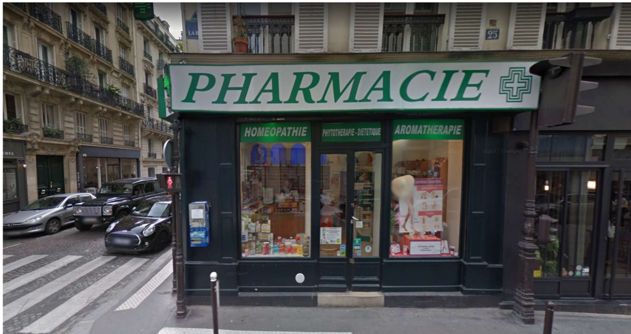
Rue La Bruyère, Paris