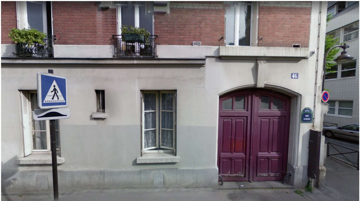
Rue Vitruve, Paris