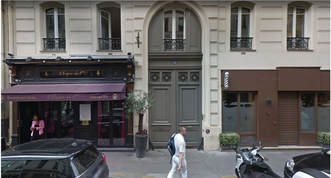
Rue Jean Mermoz, Paris